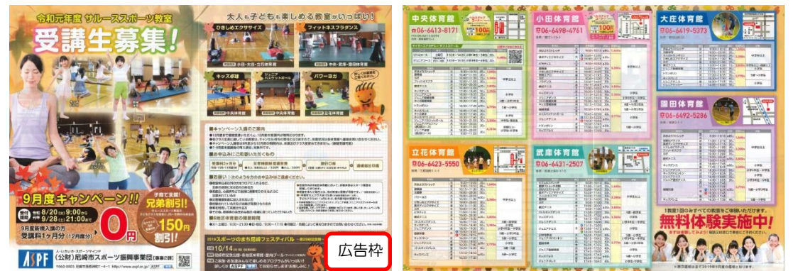
【広告掲載イメージ】