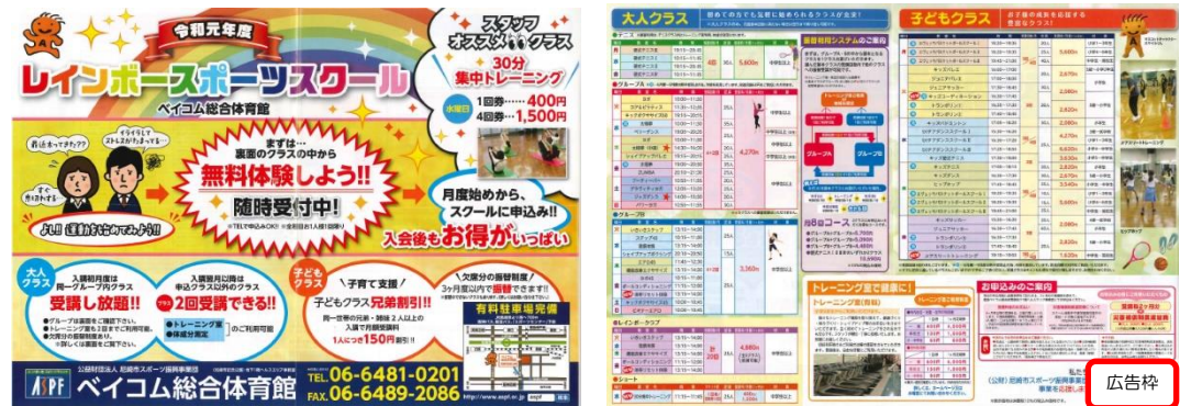
【広告掲載イメージ】