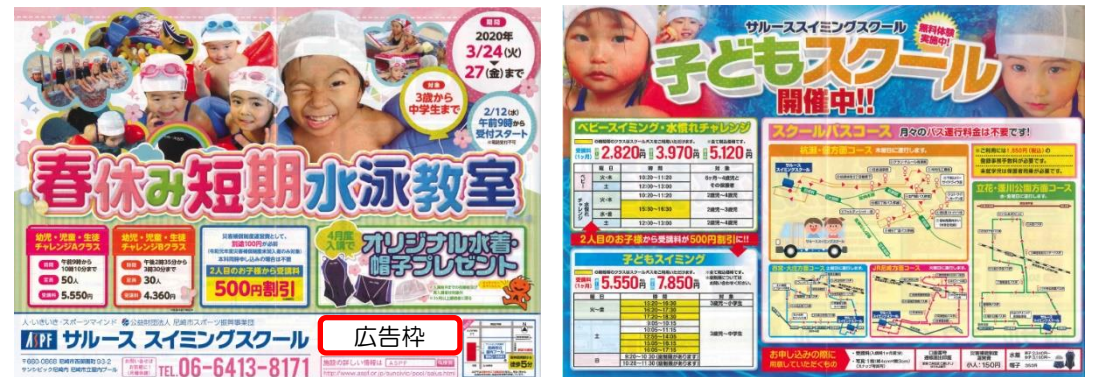
【広告掲載イメージ】