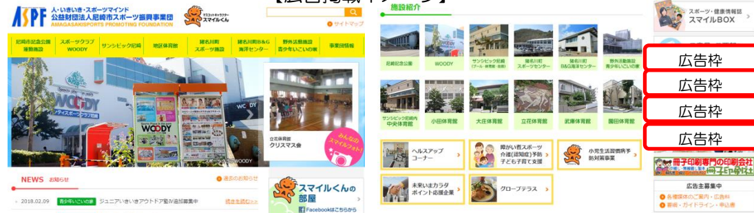
【広告掲載イメージ】