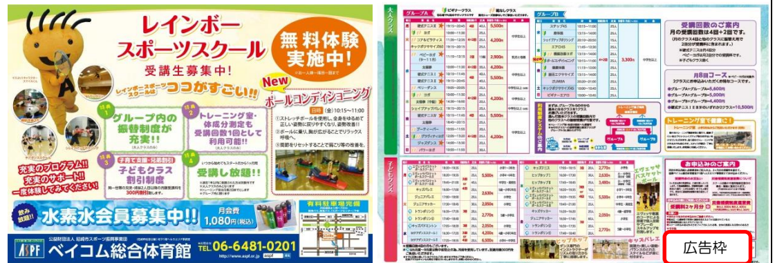
【広告掲載イメージ】