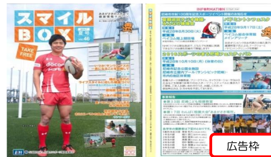
【広告掲載イメージ】