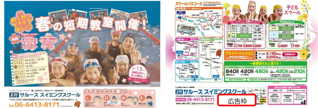
【広告掲載イメージ】