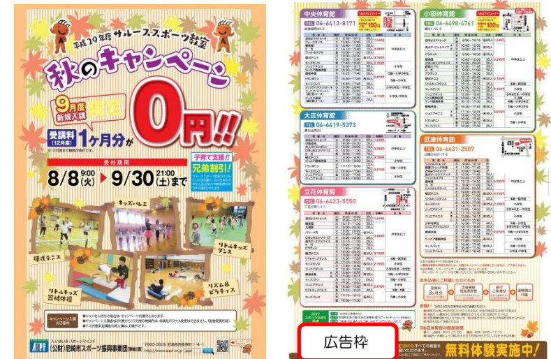
【広告掲載イメージ】